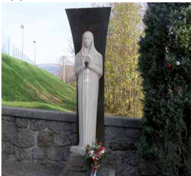
La nuova installazione della Statua della Patria, ad opera dell'architetto Pierangelo Oprandi.

L'Amministrazione comunale e la cittadinanza esprimono il loro ringraziamento al gruppo finese degli Alpini che ha raccolto l'eredità dell'Associazione Combattenti e Reduci, tenendone viva la tradizione con il proprio impegno.