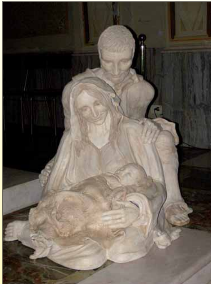
La pregevole opera in ceramica di Vittorio Vedovati, realizzata per il presepe finese

Il gruppo plastico rappresenta Giuseppe e Maria accovacciati l'uno accanto all'altro: stanno, incantati e commossi, in adorazione del Bimbo, che dorme tra le braccia della madre. Il tono intimistico con cui l'artista ha reso la scena ne fa un quadro di vita quotidiana, teneramente dimessa, ma capace di alludere con intensità al mistero dell'Incarnazione.