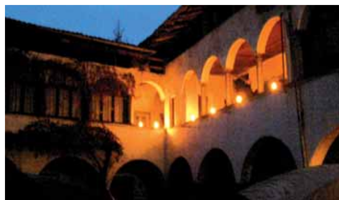
Due suggestive immagini della festa patronale: spettacolo pirotecnico e concerto vocale del gruppo Ars Nova, dalla loggia dell’ex convento