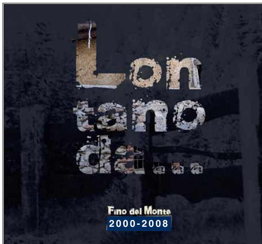
La copertina del CD che raccoglie una interessante sintesi dei concerti estivi 2000-2008