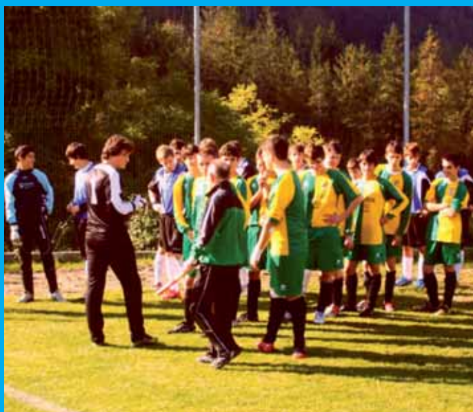
Allenamento sul nuovo prato al campo di Via Res

La collaborazione della Parrocchia, dell'Amministrazione comunale e della Pro loco hanno permesso la riuscita della manifestazione, voluta dall'Unione Sportiva Finese che la riproporrà anche per il prossimo anno.