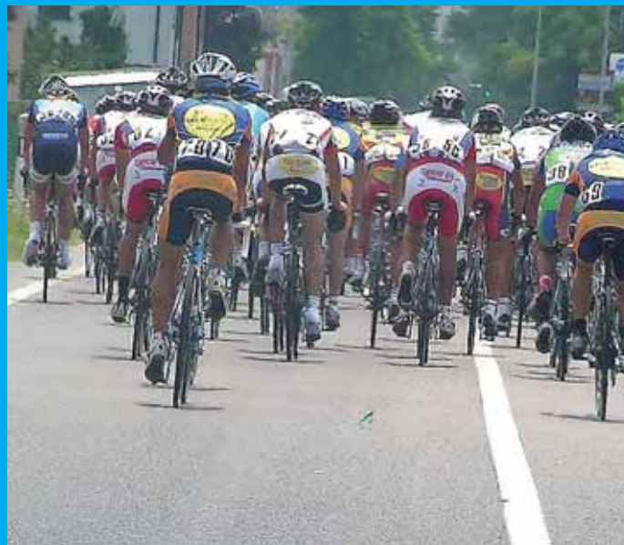
Le gioie della bicicletta