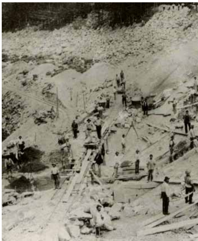
Dal libro "vidi altre terre, altre beltà ma la mia patria..." Orbey - lavori di costruzione della diga

La premiazione dei migliori allievi delle superiori e il dono ai nati nel 2008 di una tenera "Pigotta" dell'Unicef vogliono essere importanti segnali di fiducia nel futuro, per le nuove generazioni e per tutta la Comunità. Nella ormai tradizionale festa, quasi un prolungamento del Natale passato in famiglia, Fino del Monte riconferma, nonostante gli scenari poco rassicuranti, la propria vocazione alla fiducia, all'impegno e alla perseveranza.