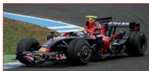
Uno dei bolidi della Toro Rosso