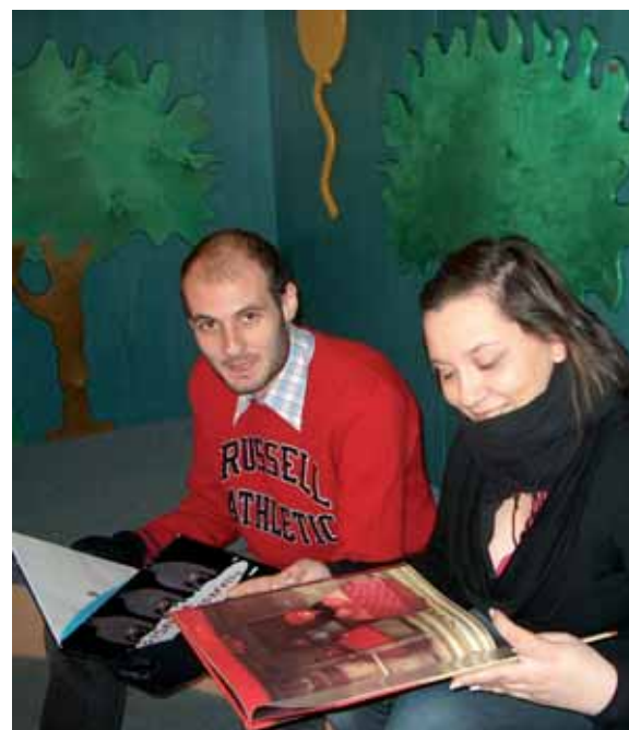
I nostri ragazzi della leva civica

Grazie a tale iniziativa, da quest'anno operano sul territorio dell'Unione quattro volontari: due impegnati sul progetto "L'Isola dei Bambini", due impegnati sul fronte delle biblioteche per attività di animazione, ampliamento dell'orario e sostituzione ferie del personale in servizio.