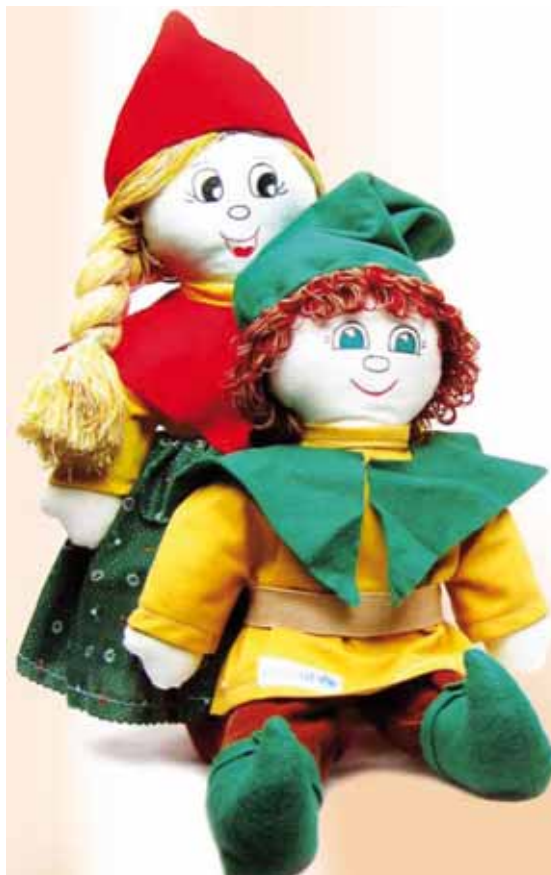
Sono tante le tenere Pigotte dell'UNICEF: una in dono per ogni nato nel 2008