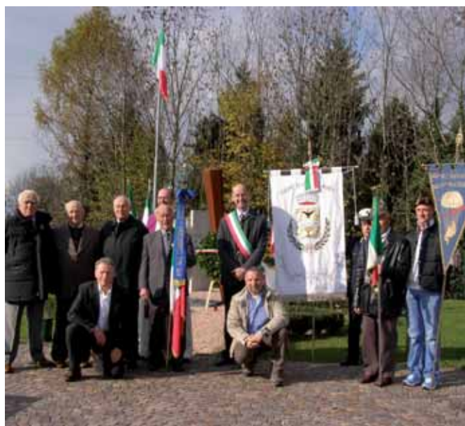
I componenti dell'Associazione Combattenti e Reduci insigniti dell'onoreficenza.

- E' invece di 122.500 euro a base d'appalto la spesa prevista per interventi di collegamento e riorganizzazione dei bacini idrici in località Aprico. Gli interventi prevedono la riorganizzazione di alcuni tratti, la dismissione di due bacini in località Pret e la sistemazione dello scolmatore fognario in località Laca per prevenire fenomeni di erosione. Analoghi problemi di erosione saranno risolti con un intervento di bonifica dello scolmatore di via Res. L'appalto è stato vinto dalla ditta Renato Toninelli di Castione della Presolana.