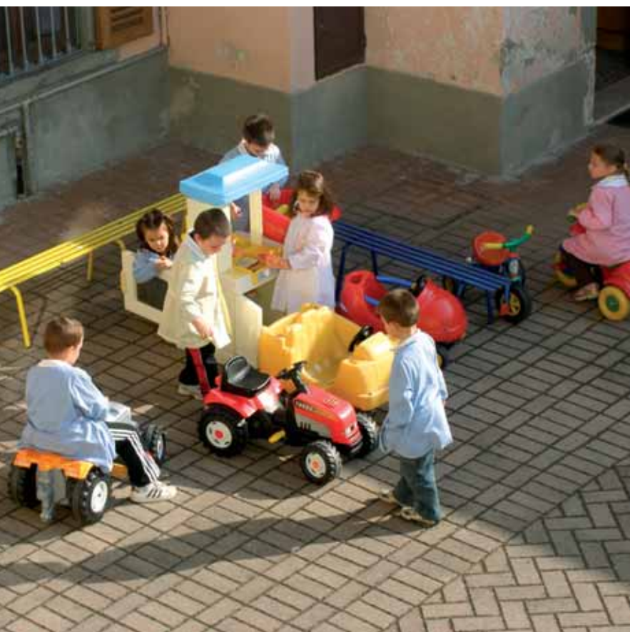
Giochi sereni alla Scuola dell'infanzia di Fino del Monte